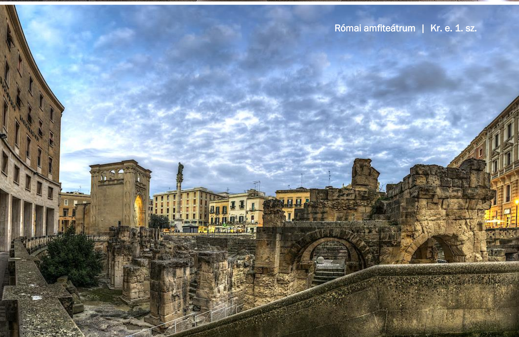
Római amfiteátrum | Kr. e. 1. sz.