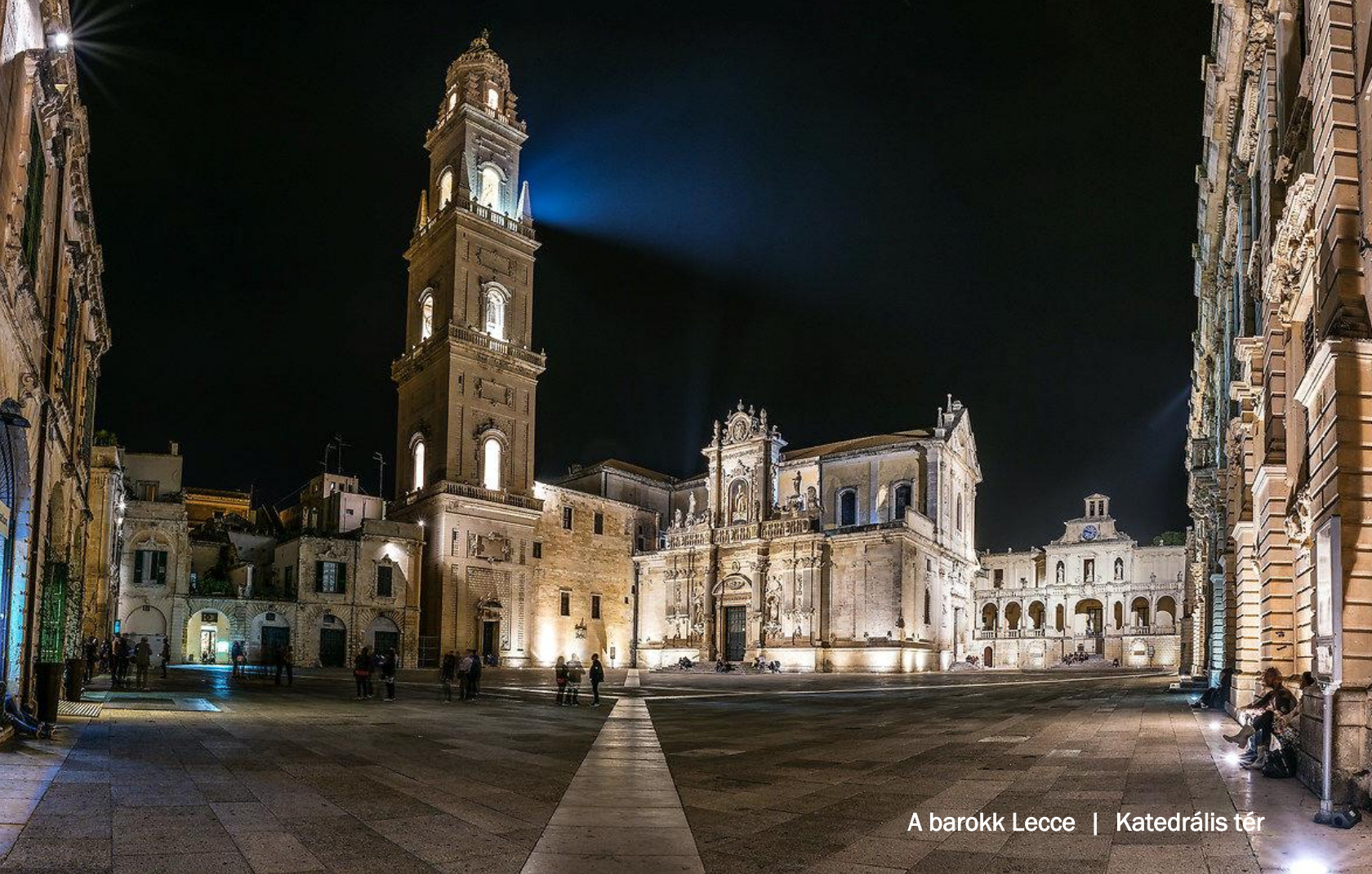
A barokk Lecce | Katedrális tér