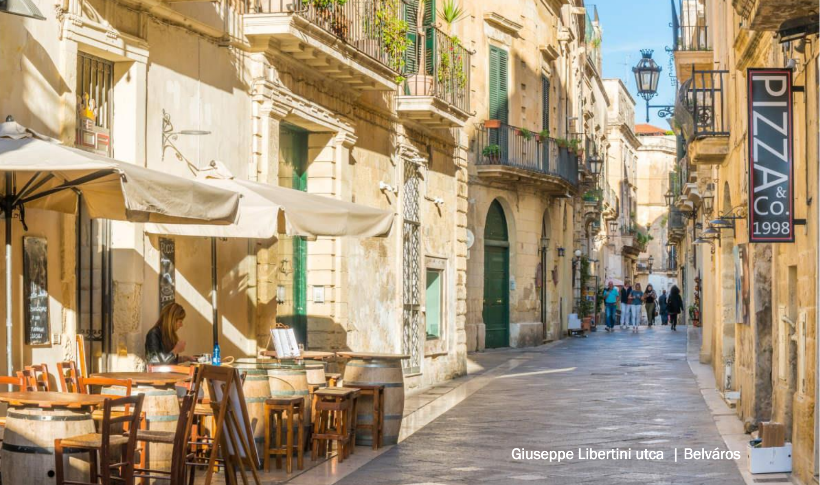
Giuseppe Libertini utca | Belváros