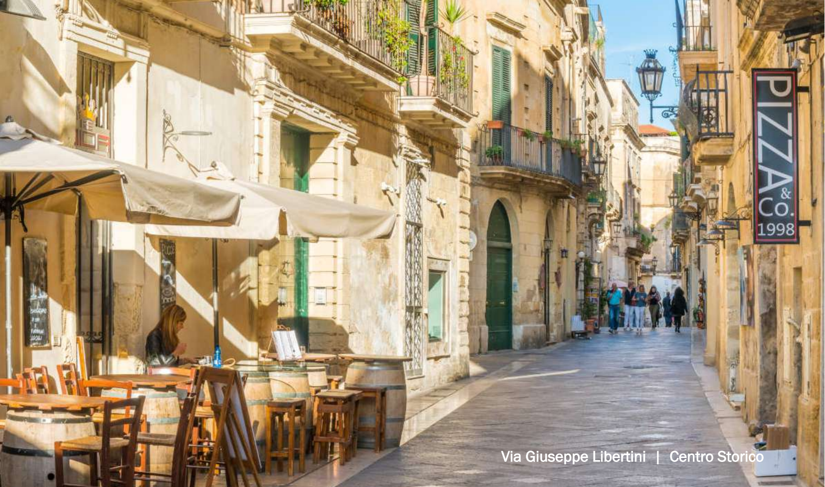
Via Giuseppe Libertini | Centro Storico