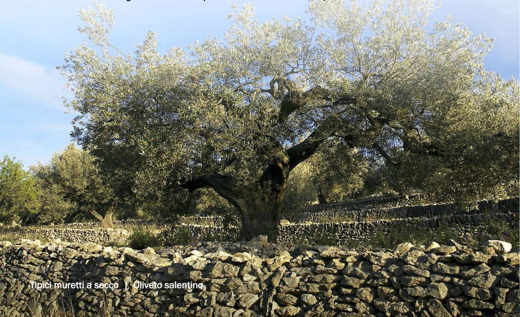
Tipici muretti a secco | Oliveto salentino

Clicca e guarda il video di presentazione: Una chiesa presbiteriana a Lecce.