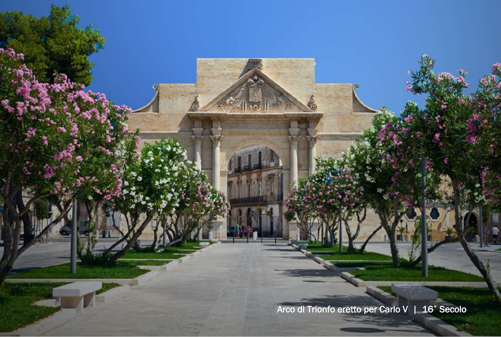
Arco di Trionfo eretto per Carlo V | 16° Secolo