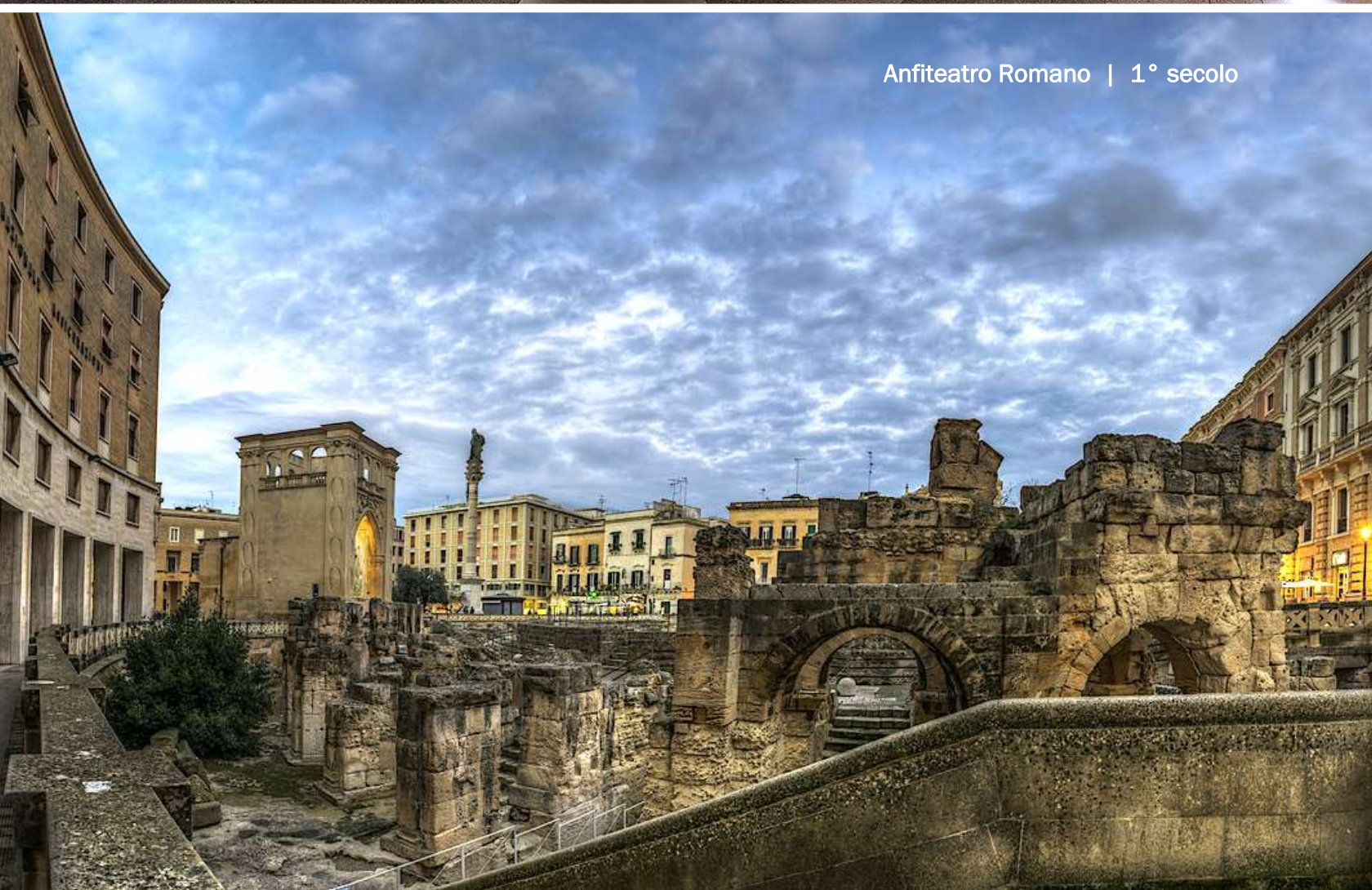
Anfiteatro Romano | 1° secolo