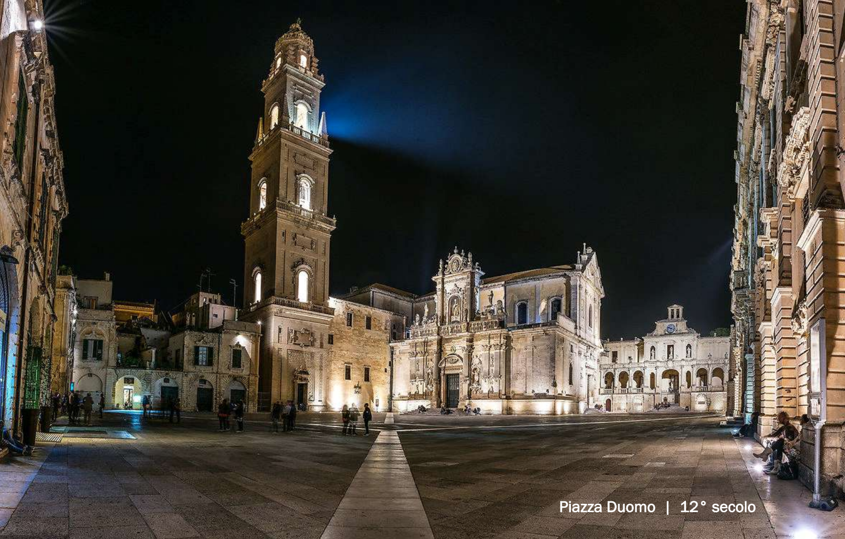
Piazza Duomo | 12° secolo